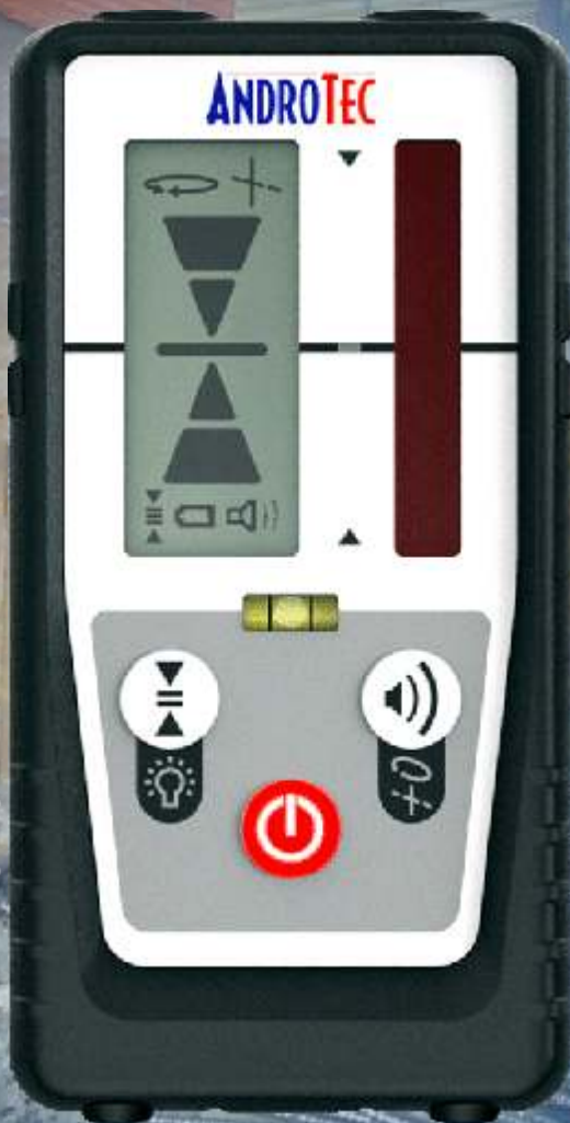
Abb. in Originalgröße

Universal-Laserempfänger Structor STR-50R für rote Rotations- und Linienlaser